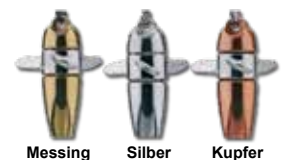
Messing Silber Kupfer

Viele Devons sind in 3 Farben Erhältlich