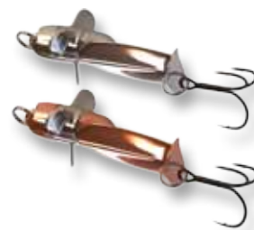
C = kupfer S = silber