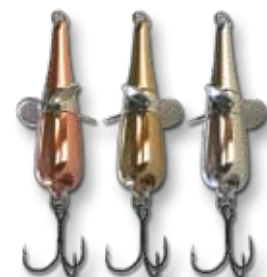
C = kupfer B = messing S = silber