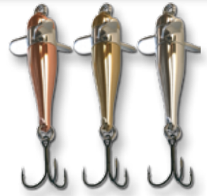
C = kupfer B = messing S = silber