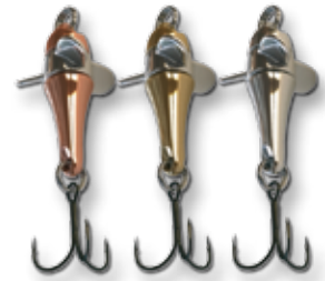
C = kupfer B = messing S = silber