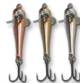
C = kupfer B = messing S = silber