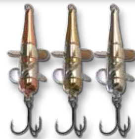
C = kupfer B = messing S = silber