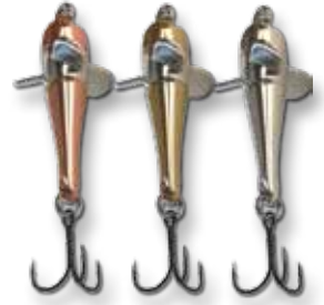
C = kupfer B = messing S = silber